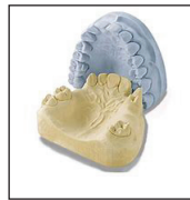
Dental Modelos de yeso o piedra