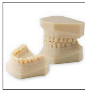
Modelos Dental digitales de resina 3D